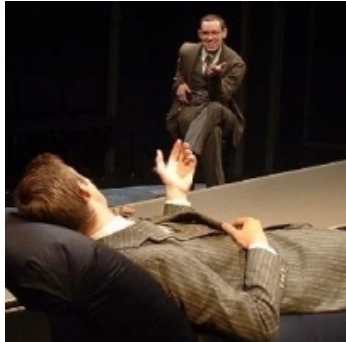
Vous n'irez plus chez votre psychothérapeute par hasard. (DR)